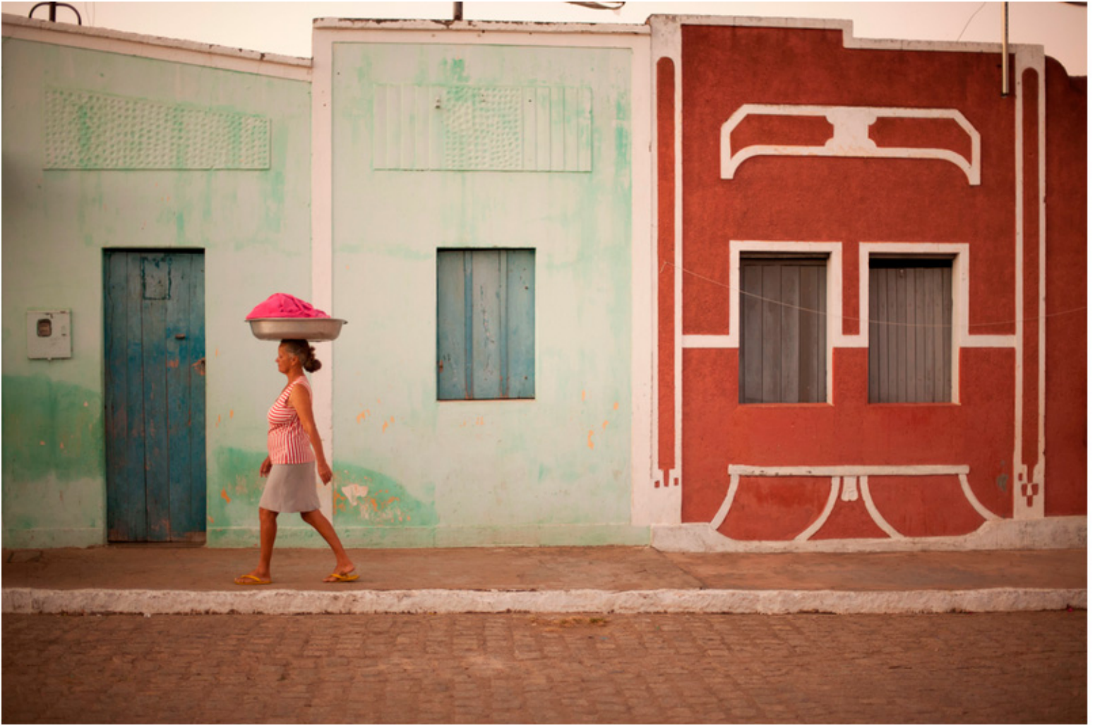
A arquitetura naif da Ilha do Ferro foi parar nos bordados.

O que: exposição Boa Noite, Ilha do Ferro