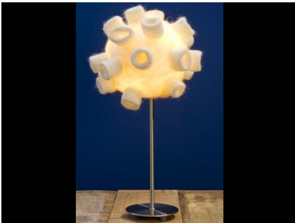
A luminária Anêmona foi premiada pelo Museu da Casa Brasileira em 2011