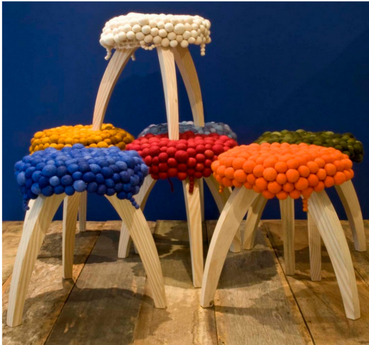
Colorido e maciez no conjunto de bancos Nuvem.