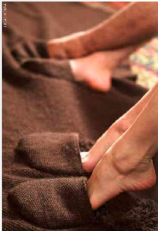
Acima, manta/tapete Pé Quente com chinelos incorporados; à esquerda, banquinhos de madeira forrados com crochê de lã; abaixo, vista da exposição, com mantas em tramados de tricô em primeiro plano, e toalhas de mesa, com divertidos desenhos bordados, no fundo, à esquerda

O evento vai até 2 de agosto em A CASA Museu do Objeto Brasileiro. Para mais informações, acesse www.acasa.org.br