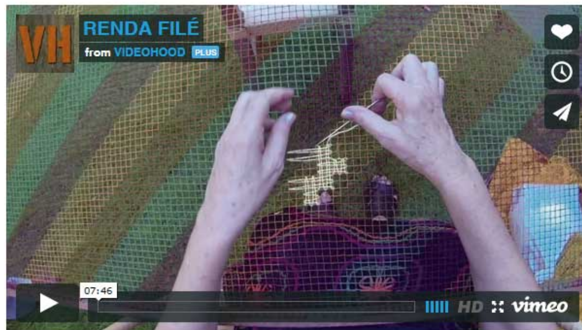
RENDA FILÉ from VIDEOHOOD on Vimeo.