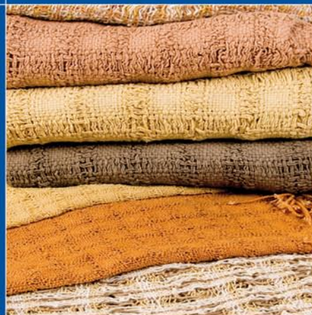
1º lugar Categoria Ação Sócio-Ambiental Projeto Veredas