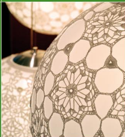
1º lugar Categoria Objeto de Produção Autoral TTLeal Luminária Cristal de Luz